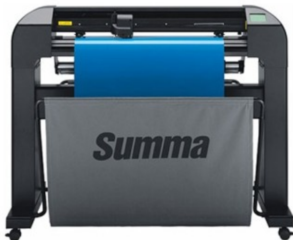
Ploteris Summa S75-T

Ploterijoje, išpjaustome raides, logotipus į įvairaus pločio, ilgio, storio plėvelių (iki 80 cm pločio). Ploteriai naudoja tangentinę technologiją, kuri remiasi motoru kontroliuojamu peilio pasukimu pagal pjovimo vektorių. Technologija pasiekia didesni smulkių detalių, šriftų tikslumą, geresnę įsirinkimo kokybę bei platesnes galimybes prapjauti itin storas ir kietesnes medžiagas.